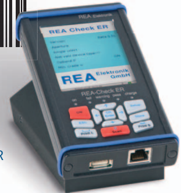
REA Check ER