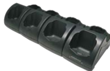
Mehrfach Lade-/Übertragungsstation (Ethernet)

Weitere Einzelheiten können Sie dem Benutzerhandbuch auf www.mobile.datalogic.com/manuals entnehmen. Mehr Informationen auch unter www.mobile.datalogic.com/datalogicjseries