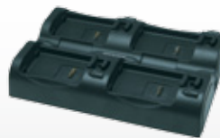
• Mehrfach Ladestationen